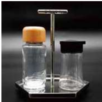
23 調味料トレイ | 材料・材質 ステンレス (SUS304) 販売価格 5,880 円

代表開発者 山村 武明 / TAKMAN / ハンドバッグ製造 〒124-0004 葛飾区東堀切 3-32-11 グリーンパーク東堀切 407 TEL 090-1538-4094