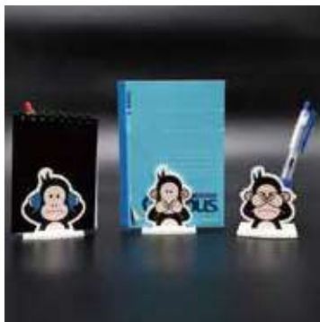
24 鉛筆型ボールペン用ジオラマスタンド | 材料・材質 アクリル樹脂 販売価格 1,000 円～

代表開発者 加藤 茂明 / 有限会社オリオン機工 / 製造業 〒116-0001 荒川区町屋 6-10-4 TEL 03-3895-1395