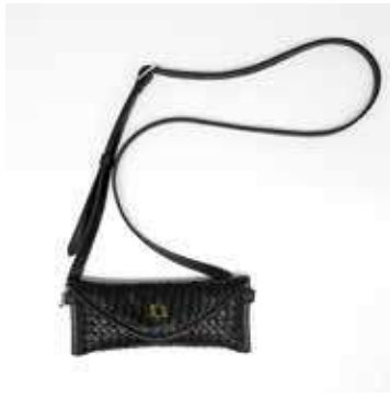
21 エチオピアシープ手刺しメッシュ 小物シリーズ ショルダータイプ眼鏡ケース | 材料・材質 シープレザー・綿 販売価格 26,000 円

世界でも希少価値の高い、私がエチオピア現地で出会ったエチオピアシープの刺しメッシュを主材にした斜め掛けで使用できる眼鏡ケースです。眼鏡を置き忘れる事が最小限に抑えられると思います。ショルダーと本体は取り外しも可能にしてあります。1枚のシープの厚みは0.9mm～1mm程度で、そのまま切り込みに刺してメッシュに仕上げるのにとっても手間暇がかかっています。手触りがとても良く、丈夫でしなやかなのが特徴的です。内装はアフリカ生地を使用しています。