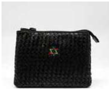
22 エチオピアシープ手刺しメッシュ 小物入れ ポーチ | 材料・材質 シープレザー・綿 販売価格 19,000 円

代表開発者 山村 武明 / TAKMAN / ハンドバッグ製造 〒124-0004 葛飾区東堀切 3-32-11 グリーンパーク東堀切 407 TEL 090-1538-4094