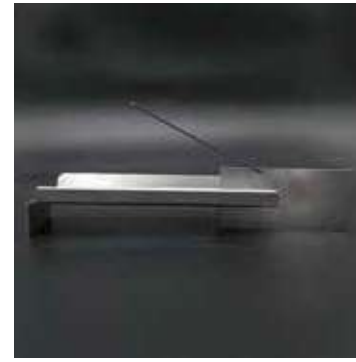
25 Susedge | 材料・材質 ステンレス (SUS304) 販売価格 3,910 円

代表開発者 松下 栄吉 / 伽羅企画 / 広告グラフィックデザイン 〒110-0012 台東区竜泉 2-13-1 葉山ビル 702 TEL 090-2630-7195